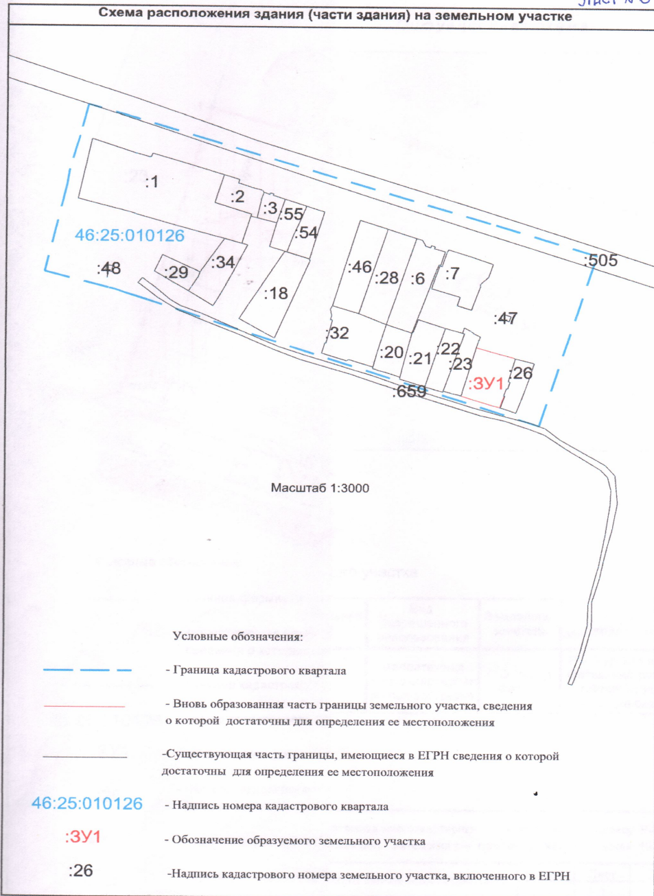
Схема расположения здания (части здания) на земельном участке